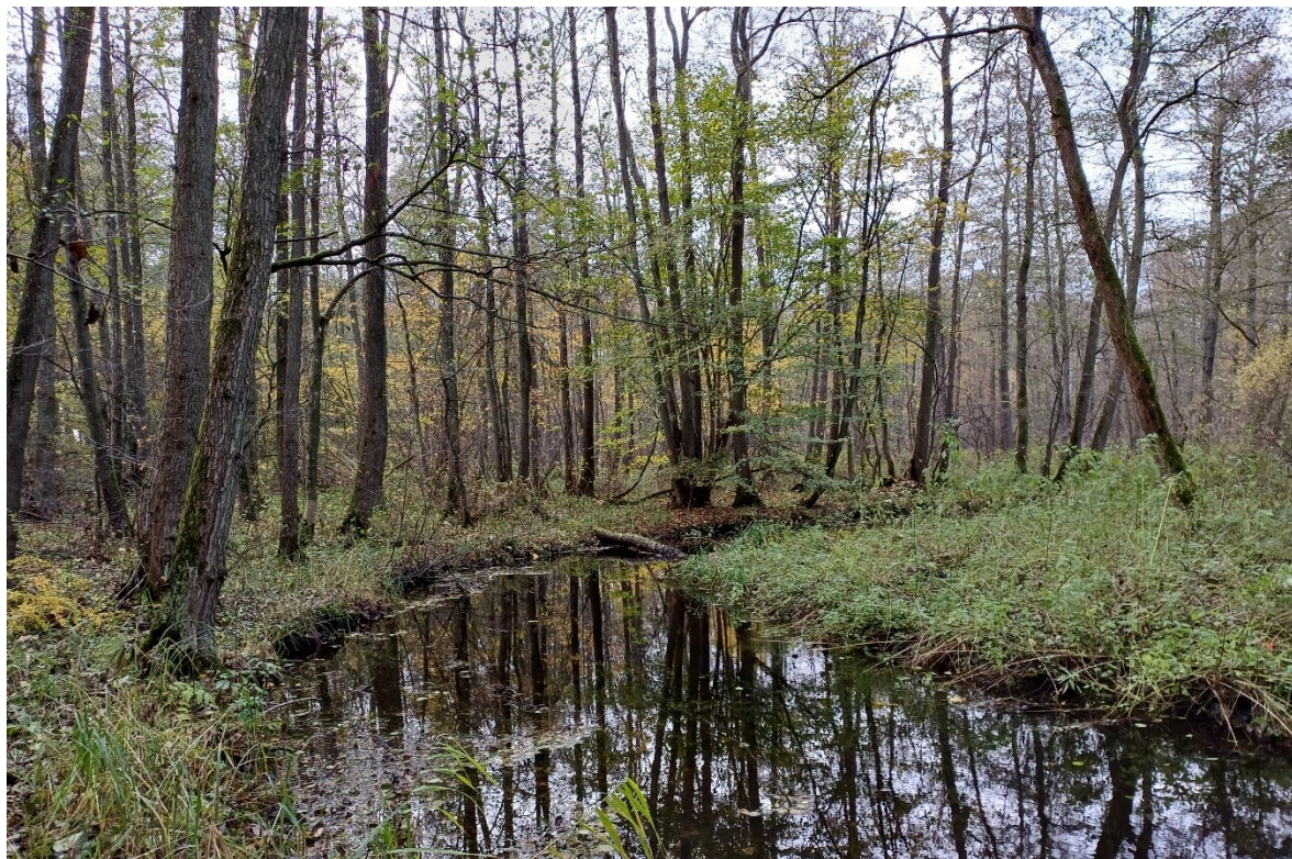
Skovnaturtypen elle- og askesump findes stedvis rundt i skovene og er udbredt langs Brændegård Sø, Nørresø og Silkeå som på billedet ovenfor.

*** Skovnaturtypebevarende drift og pleje dækker over flere indsatser, heriblandt sikring af naturtyper, træer til naturligt henfald, naturnær skovdrift, rydning af uønsket opvækst, problemarter og invasive arter samt skovgræsning og foryngelse.