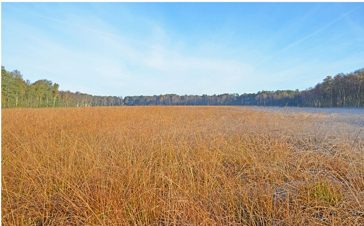
Højmosen Nybo Mose er under tilgroning med blåtop bl.a. grundet uhensigtsmæssig hydrologi.

Indsatserne har dog kun omfattet mindre dele af de arealer der tidligere har været drænet. Der er derfor et fortsat behov for at genskabe mere optimal hydrologi i området.